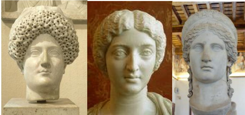
Rys. 7. Przykłady fryzur rzymskich