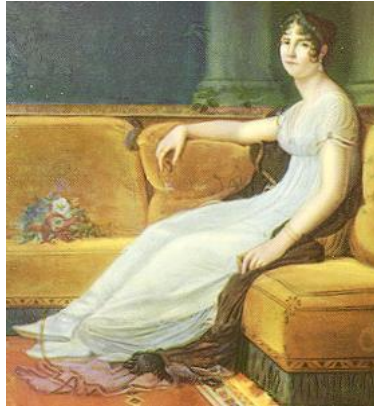
Rys. 12. Przykłady fryzur z okresu dyktoriał

W późniejszym okresie weszły w modę włosy zaczesane do przodu, nachodzące z baczkami lub bokobrodami.