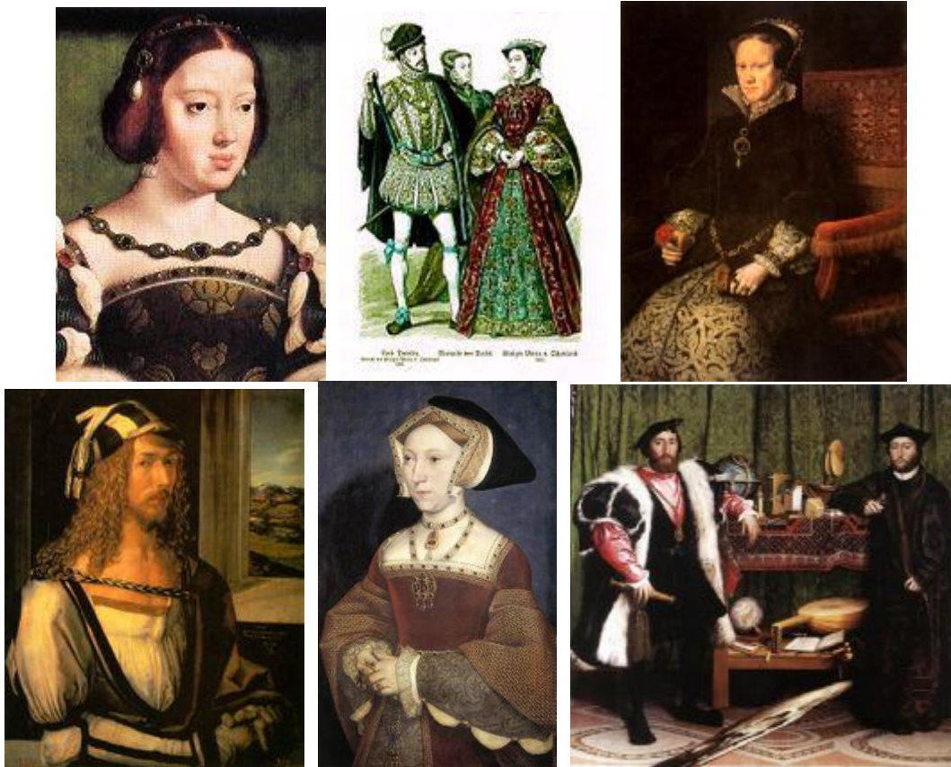
Rys. 9. Przykłady fryzur okresu renesansu