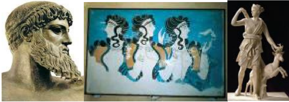
Rys. 5. Układanie włosów – ceremonia