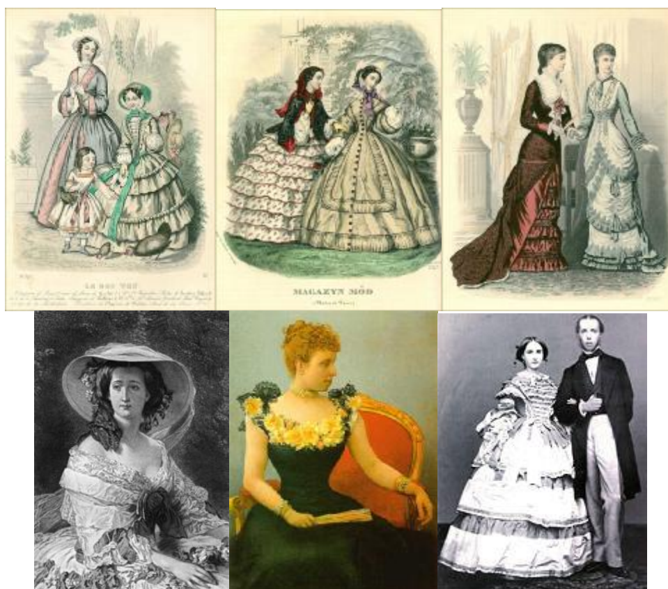
Rys. 15. Styl empire

Druga połowa XIX wieku to okres częstych zmian w modzie. We Francji rozwinął się styl zwany drugie rokoko lub drugi empire. Ton modzie dyktowała cesarzowa Eugenia, żona Napoleona III. Wprowadzenie lekkiej konstrukcji krynoliny pozwoliło zwiększyć obwód sukien. Upowszechniła się moda na pantalony. Modne były niskie fryzury, z włosami spływającymi po obu stronach policzków, przechodzące w kok z tyłu głowy. Do nakrycia głowy służyły koronkowe czepeczki (fanszoniki). W latach siedemdziesiątych moda zaczęła nawiązywać do form barokowych. Fryzury stały się wysokie o pionowej linii. Często ozdobą tyłu fryzury był warkocz lub szereg anglezów. Ważnym dodatkiem były małe kapelusze zdobione wstążkami i kwiatami noszone skośnie do przodu z małymi woalkami. Suknie zostały rozcięte z przodu. Górną spódnicę zaczęto spiętrzać na tyle tworząc turniurę. Kolejna dekada przynosi fryzury uproszczone. Włosy zaczesywano luźno do góry tworząc niewielki kok. Modne stają się bufiaste rękawy i wysokie kołnierze. Uproszczone również fryzury męskie wprowadzając proste uczesania ze znacznie skróconych włosów nabłyszczanych i wygładzanych brylantyną. Panowie zapuszczali wąsy i brody. Za nakrycie głowy służył cylinder, angielski melonik lub w lecie słomkowy kapelusz.