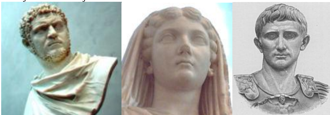
Rys. 6. Przykłady fryzur rzymskich

Okres panowania królów i republiki charakteryzuje się prostotą i skromnością. Mężczyźni nosili krótkie włosy i golili zarost (na wzór Scypiona Afrykańskiego Starszego), kobiety czesały włosy w węzeł z tyłu głowy podtrzymywany wstęgą. We fryzurach kobiecych z okresu początku cesarstwa przejawia się przepych i przesada. Uczesania były bardzo skomplikowane i ozdobne, uzupełniane obcymi splotami włosów (niekiedy w kolorze własnych). Stosowano peruki. Modną była fryzura a la Tytus wykonana z drobnych loczków tworzących nad czołem zwarty wałek, z reszty włosów splecionych w drobne loczki tworząco wysoko nad karkiem kok. W II w.n.e. fryzury damskie osiągają największe rozmiary. Drobne loczki tworzące przód fryzury w formie diademu wymagają specjalnego podparcia. Z tyłu włosy tworzą zwarty kok ze spiralnie skręconego warkocza. Skromniejsza jest fryzura z włosami podwyższonymi nad czołem w formie wałka z resztą włosów zaplecioną w drobne warkoczki uchwycone razem w pętlę. Wysokość fryzur dochodzi niemal do wysokości twarzy. W okresie próżnego antyku fryzury stają się skromniejsze i naturalniejsze.