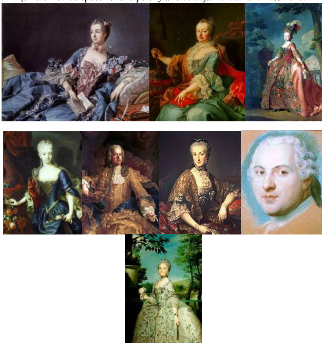
Rys. 11. Przykłady fryzur okresu rokoko