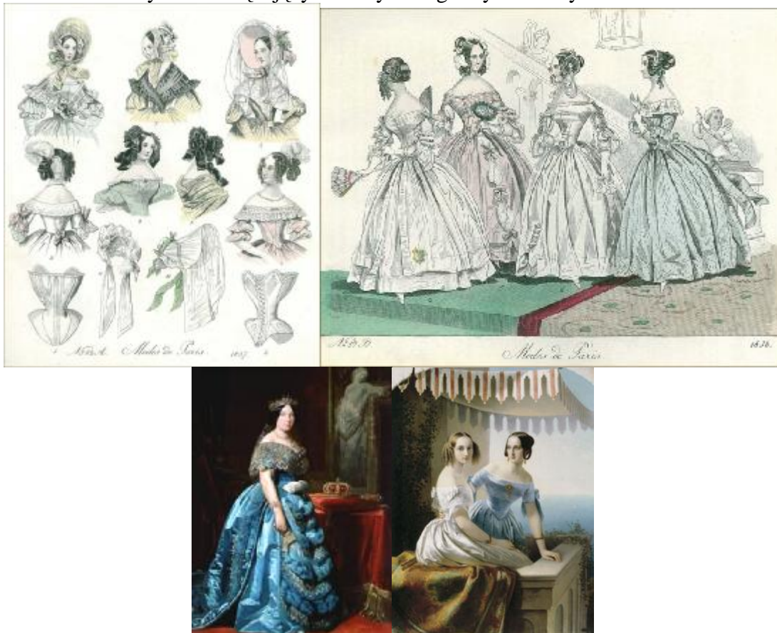
Rys. 14. Styl biedermeieru