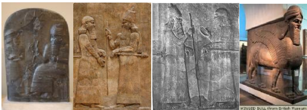
Rys. 2. Okrycia głowy królów

Królowie na znak władzy nosili nakrycia głowy w formie stożka ozdobionego obręczami ze spadającymi na ramiona wstęgami.