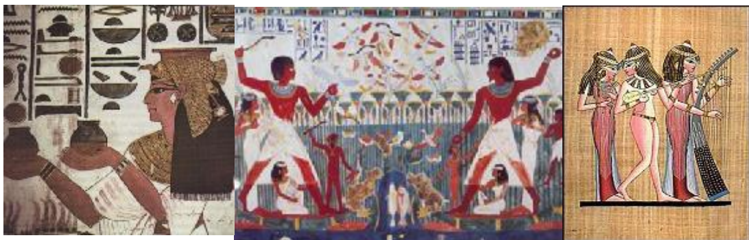
Rys. 3. Pielęgnacja włosów i ciała w starożytnym Egipcie