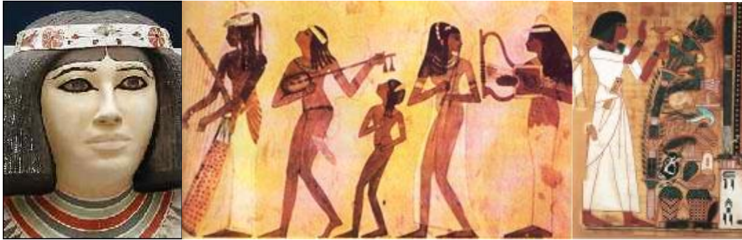
Rys. 4. Pielęgnacja włosów i ciała w starożytnym Egipcie