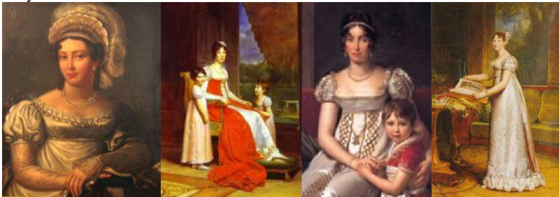
Rys. 13. Przykłady fryzur za panowania Napoleona

Styl obowiązujący za panowania cesarza Napoleona Bonaparte. Powrócono do codziennej pielęgnacji ciała. Stosowano maseczki i kąpiele z mleka, okłady z ogórka były rzeczami podstawowymi przy pielęgnacji ciała. Włosy myto żółtkami jaj. Obficie używano perfum, pudrów i szminek. Nadal modne były suknie z podniesionym stanem oraz bogato haftowane złote mundury. W modzie męskiej pojawił się frak uzupełniony kamizelką. Pod szyją zawiązywano chustkę. Całość dopełniały białe dopasowane spodnie. Fryzury stylizowano na uczesania antyczne. Wśród mężczyzn furorę robiła „fryzura rozwiana wiatrem” (nosił ją sam Napoleon), uzupełniona bakami lub loki spiętrzone nad czołem. Typowym kapeluszem był dwurożny bicorne. Kobiety również wzorowały się na antyku. Fryzury obfitowały w duże ilości kosztownych ozdób. Nakryciami głowy były turbany, koronkowe czepeczki i antyczne hełmy.