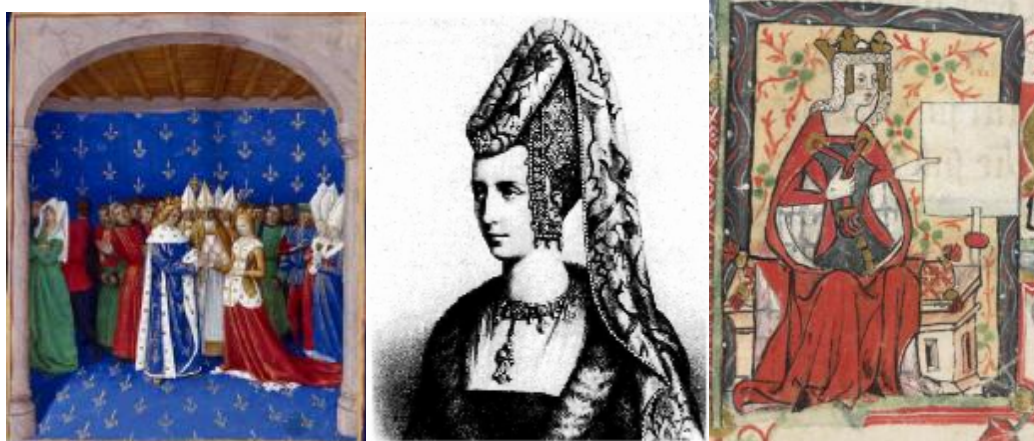
Rys. 8. Przykłady fryzur średniowiecznych