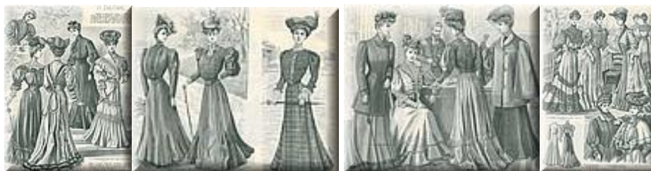
Rys. 16. Sportowe garnitury

fantazyjne kształty. Mężczyzna w secesji nosił krótkie włosy i niewielki zarost. Pojawiły się nowe fasony kapeluszy. Coraz częściej pojawiają się sportowe garnitury.