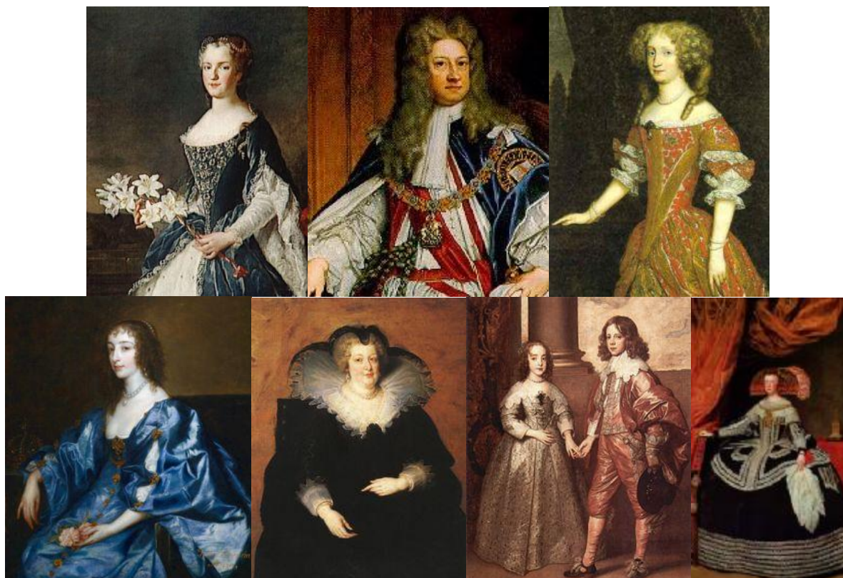
Rys. 10. Przykłady fryzur okresu baroku

Zmniejszyły się brody i wąsy, podkreślano je do góry lub golono tak, że pozostawał tylko zarys w postaci cienkich kreseczek. Kobiety nosiły niskie fryzury z miętko opadającymi lokami wokół policzków, krótką grzywką oraz resztą włosów zaczesaną do tyłu i upiętych w płaski kok (Anna Austriaczka, żona Ludwika XIII). Tłem dla owalu twarzy był koronkowy kołnierzyk oparty na lekkim stelażu. W latach 70 fryzura uległa podwyższeniu. Krótką grzywkę nad czołem zastępują piętzące się drobne loczki, z tyłu głowy noszony jest czepeczek. W późniejszym okresie bardzo modny stał się fontanges, określany jako kornet (w Polsce nazywany czubem) wprowadzony do mody przez faworytę Ludwika XIV to koronki ustawione z przodu nad sobą w trzech pionowych rzędach oparte są na stelażu. Spod czepka widoczna była tylko część włosów przy twarzy, układana w loki. Moda hiszpańska pozostawała w izolacji od wpływów francuskich. Obowiązywało powiększenie uczesania przez zakładanie na włosy peruk. Sztuczne dodatki układano symetrycznie po bokach twarzy w pięciu rzędach i skręcano, z tyłu włosy ujmowano w kok i ozdabiano piórami.