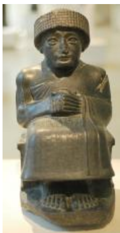
Rys. 1. Sumer